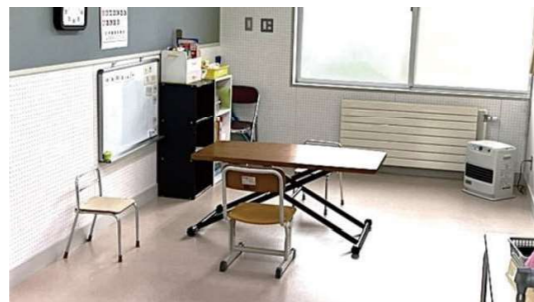
1対1の個別支援は環境づくりが大切です。子どもたちとしっかり向き合える部屋を用意しています。