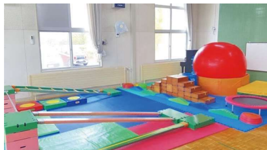
写真にあるような大きな遊具のほかにも、いろいろなおもちゃもそろえてありますよ♪